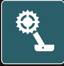
ドライブトレイン